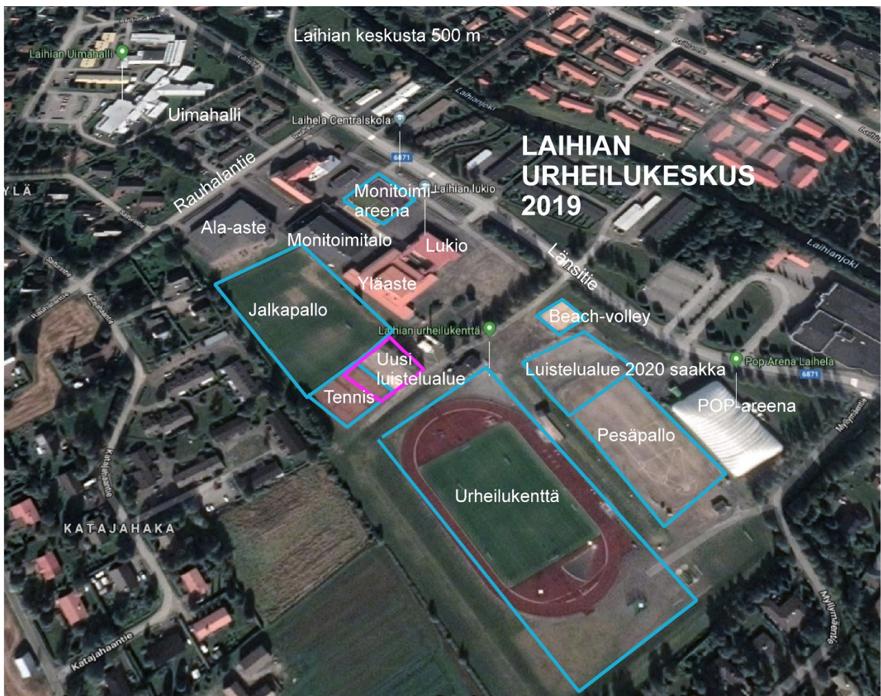
Kuva 1. Laihian urheilukeskusalue 2019.

Urheilukeskusalue sijaitsee Laihian kunnan keskustan kupeessa. Alueella toimivat esikoulu, alakoulu, yläkoulu ja lukio, yhteensä noin 1200 oppilasta. Aluetta käyttävät koulujen liikuntatuntien lisäksi urheiluseura Laihian Lujan eri jaostot. Kilpailu- ja harjoitustoiminta on aktiivista pesäpallossa, jalkapallossa ja yleisurheilussa. Kiinteät urheilualueet urheilukeskusalueella ovat beach-volleykenttä, tenniskentät 2 kpl, pesäpallokenttä, yleisurheilukenttä, jalkapallokentät (keskuskenttä + 3 kenttää monitoimitalon yhteydessä), monitoimitalo, monitoimitalon kuntosali, yläkoulun liikuntasali (painisali), monitoimiareena ja talvisin jääkiekkokaukalo ja yleisluistelualue (Kuva 1). Lisäksi alueella on jalkapalloilijoiden rakentama ja hallinnoima POP-Areena, jalkapallohalli.